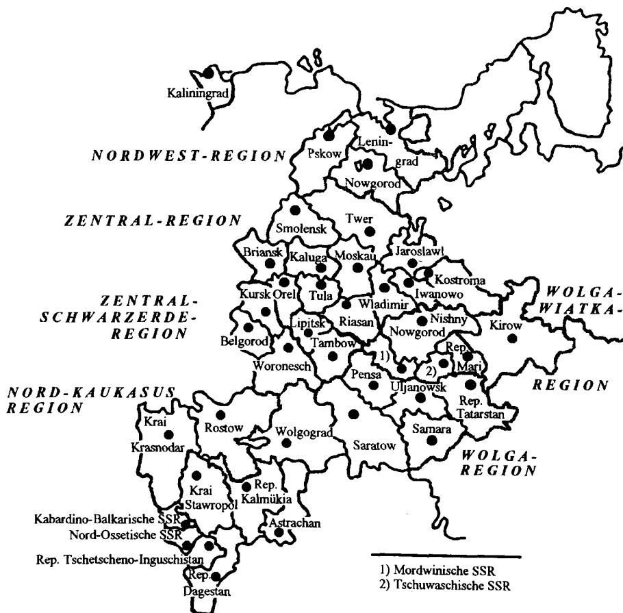
Abb. 1 – Regionale Gebietskörperschaften der Oblast-Ebene und Wirtschaftsregionen in der Russischen Föderation (Gebietsstand 1989) – Westlicher Teil.

chen Rohstoffausfuhren finden sich in den Clustern (1) und (2) mit Schwerpunkten in den Bereichen Holz und Papier bzw. Metallurgie. Die Republik Sacha-Jakutien in Cluster (10) zeichnet sich durch bedeutende Exporte von Diamanten und Edelmetallen aus ( Bradshaw 1992, 27). Alle diese rohstoffexportierenden Regionen würden von einer größeren regionalen Autonomie profitieren, die die Verfügungsgewalt über die örtlichen Rohstoffvorkommen und damit die Rohstoffrenten einschließt.