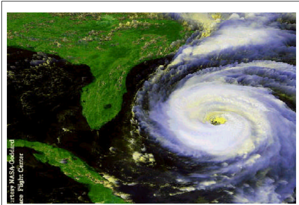
Abb. 1: NASA Satellitenaufnahme des Hurrikans „Fran“