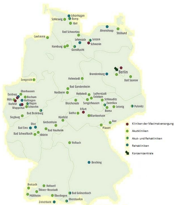
Abbildung 2: Verteilung der Kliniken der Fresenius HELIOS-Kliniken Gruppe

Da für eine Fusion auch die räumliche Verteilung der Krankenhäuser eine wichtige Rolle spielt, ist zu erwähnen, dass Kliniken von Fresenius HELIOS vor allem in West-, Nord- und Südwestdeutschland vertreten sind. Die Mitte Deutschlands hat in der bisherigen Aufstellung des Unternehmens eine geringere Rolle gespielt (Abbildung 2). Bemerkenswert ist nun, dass die Rhön-Klinikum AG vor allem im zentralen und im Süden Deutschlands vertreten ist (Abbildung 3).