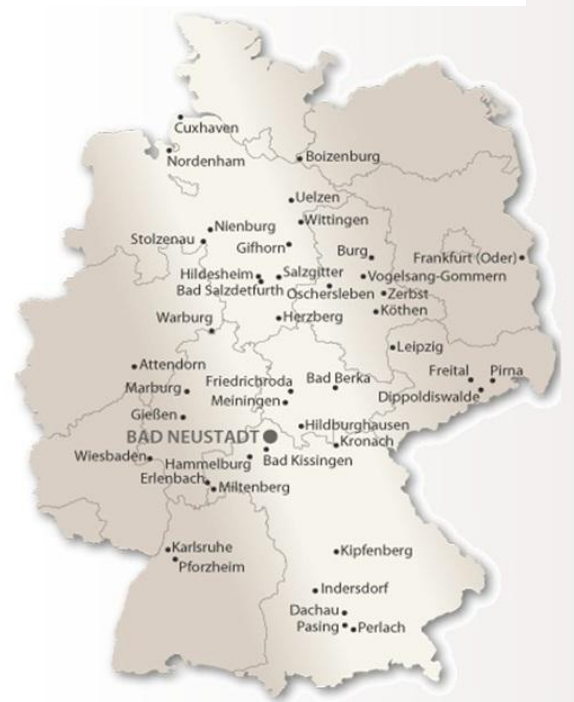
Abbildung 3: Verteilung der Kliniken der Rhön-Klinikum AG