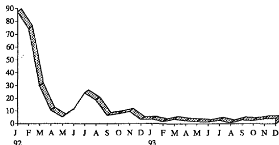
Schaubild 3 — Die monatliche Veränderung der Verbraucherpreise in Estland zwischen Januar 1992 und Dezember 1993 (vH)