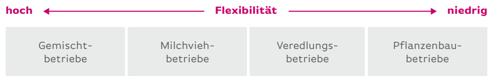
Abbildung 2: Verteilung der Flexibilität nach Betriebsausrichtung