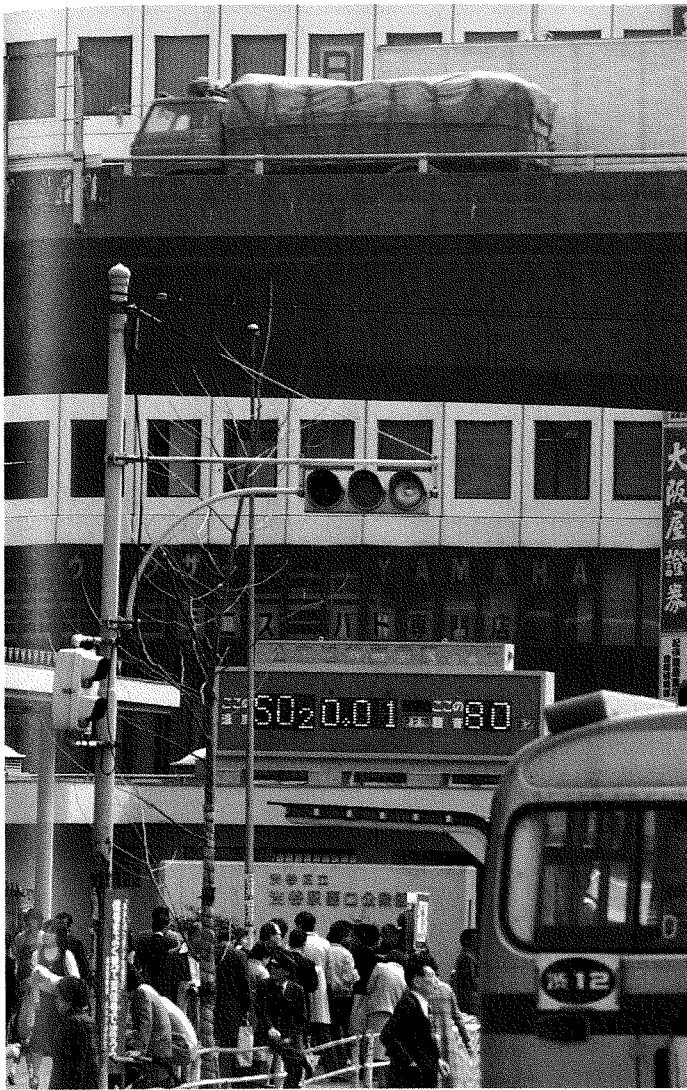
Foto 1: Elektronische Anzeigetafeln übermitteln den Einwohnern in den japanischen Dichtezentren (wie hier in Tōkyō) laufend Angaben über die Schad- stoffbelastung der Luft