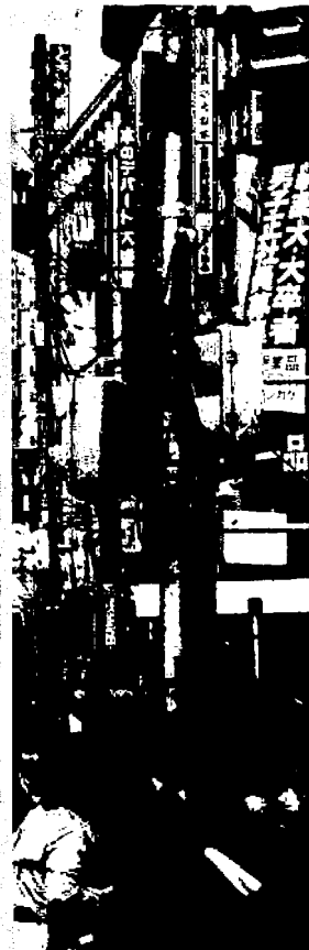
Eine Hauptstraße in Tokio. Die Weltstadt im fernen Osten ist wesentlich sauberer geworden durch konsequenten Umweltschutz