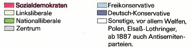
Sitzverteilung der Parteien im Deutschen Reichstag 1871–1912

Bismarck. Auch die Zentrumspartei , die Partei des Katholizismus, stand in Gegnerschaft zu Bismarcks Politik. Der neue Nationalstaat unter Führung des vorwiegend protestantischen Preußen verlangte die Unterordnung der katholischen Kirche. Deren übernationalen Bindungen waren vielen national denkenden Zeitgenossen ein Dorn im Auge. Die Kulturpolitik der siebziger Jahre (Gesetze zur staatlichen Beaufsichtigung der katholischen Geistlichen, Festigung der staatlichen Schulaufsicht, Verbot des Jesuitenordens, Gesetz über die Zivilehe 1874/75) fand die Billigung der Liberalen, führte aber zum Widerstand der Katholiken. Man sprach vom „Kulturkampf“ zwischen preußischem Staat und Katholizismus (siehe S. 129). Auch die kleine linksliberale Deutsche Fortschrittspartei stand in der Opposition: Ihr waren die liberal-demokratischen