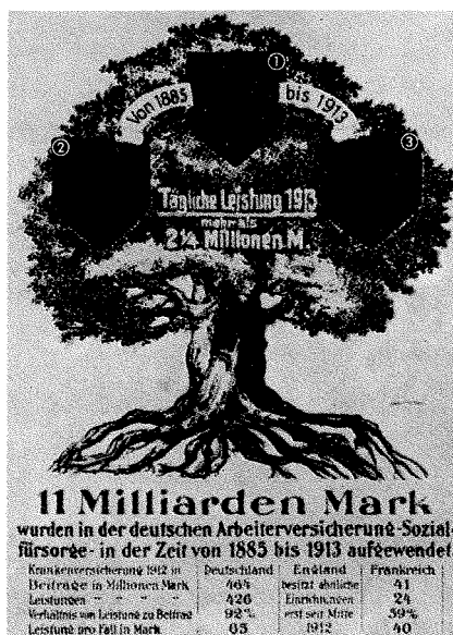
Ausschnitt aus einem Plakat zur Leistung der Sozialversicherungen, um 1914

Nach der Absicht Bismarcks sollte die Sozialversicherung auch der Sozialdemokratie den Wind aus den Segeln nehmen. Dies gelang zwar nicht, aber die