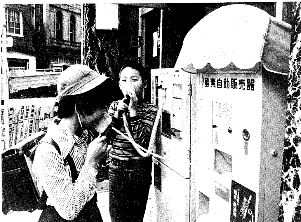
Für ein paar Yen saubere Luft: Sauerstoffautomaten wie dieser in Tokio existieren heute nicht mehr.

orientierte Entwicklungen im gesellschaftlichen und juristischen Bereich erzwangen einige nachhaltige Änderungen der staatlichen Umweltpolitik.