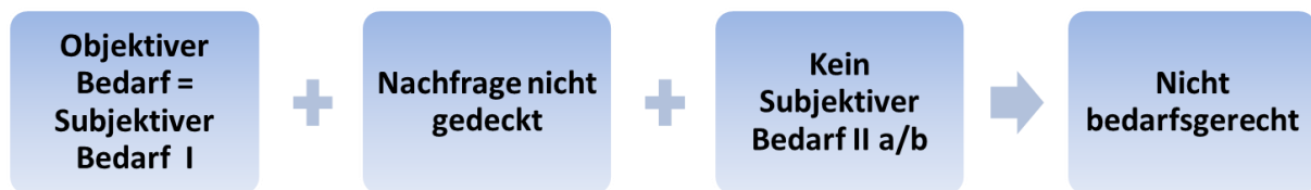
Abbildung 2: Mangelnde Bedarfsgerechtigkeit pflegerischer Versorgung, eigene Darstellung.