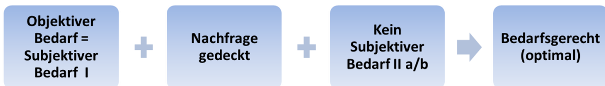
Abbildung 1: Bedarfsgerechtigkeit pflegerischer Versorgung, eigene Darstellung.

Sind diese Bedingungen auf individueller und gesellschaftlicher Ebene voll erfüllt, sind sowohl das Pflegesystem insgesamt wie auch die pflegerische Versorgung aller Pflegebedürftigen optimal, d. h. bedarfsgerecht (Abbildung 1).