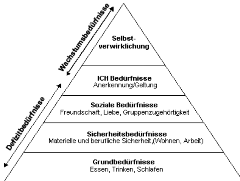
Abbildung 3: Bedürfnispyramide nach Maslow (1943).

Grundsätzlich besitzen Menschen bestimmte Bedürfnisse, welche entweder angeboren oder erlernt sind (Maslow, 1954; McClelland, 1961, 1984, 1985; McClelland et al. 1989; Yukl, 1990,). Dabei wird z. T. unterstellt, dass Bedürfnisse hierarchisch organisiert sind. Zu den bekanntesten hierarchischen Darstellungen gehört die Bedürfnispyramide von Maslow (1943, 1970), nach der Bedürfnisse höherer Ordnung erst bedeutsam werden, wenn darunterliegende Bedürfnisse befriedigt worden sind (Abbildung 3).