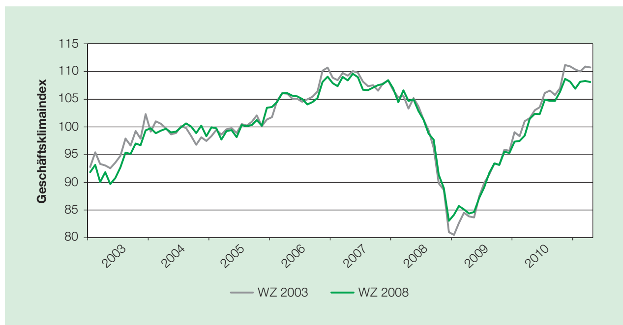
Abbildung 2: ifo Geschäftsklimaindex für das ostdeutsche Verarbeitende Gewerbe nach WZ 2003 und WZ 2008 (2005 = 100)

Quelle: ifo Konjunkturtest, Darstellung des ifo Instituts.