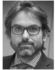
Marc Oliver Bettzüge

Die Beibehaltung eines nationalen Gesamtziels zusätzlich zum Nicht-ETS-Ziel stellt somit implizit eine Zielvorgabe für die deutschen ETS-Sektoren innerhalb des EU ETS dar, und damit letztlich eine Vorgabe für die Verteilung der Emissionen zwischen Deutschland und den anderen EU-Mitgliedstaaten. Deutschland wird die EU-Vorgabe für die Nicht-ETS-Sektoren für das Jahr 2020 voraussichtlich in etwa treffen. Verbindet man diese Zielmarke mit dem nationalen 40%-Gesamtziel, würde sich für die deutschen ETS-Sektoren implizit ein Minderungsziel von minus 34% zwischen 2005 und 2020 ergeben. Damit würde Deutschland in den ETS-Sektoren deutlich überproportional zur Gesamt-EU (minus 21%) mindern. Das 40%-Ziel erweist sich also als eine geplante Übererfüllung entweder der EU-Vorgabe in den Nicht-ETS-Sektoren und/oder des EU-Durchschnitts in den ETS-Sektoren, wobei aus den genannten Gründen nur die erstgenannte Übererfüllung klimapolitisch wirksam wäre.