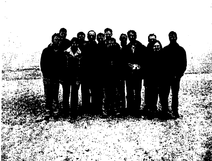
Abbildung 2: Doktorandenseminare des Graduiertenkollegs in Sehlendorf 18.–19. April 2004 und 09.–10. November 2004 „Betriebswirtschaftliche Aspekte lose gekoppelter Systeme und Electronic Business“