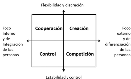
Figura 1. La tipología de valores en competencia de Quinn y Rohrbaugh (1983) y Cameron et al. (2006)

Una teoría situacional que también involucra al LOG es el Marco de Valores en Competencia (Cameron et al. , 2006; Hartnell et al. , 2011; Quinn and Rohrbaugh, 1983). El MVC es un modelo de culturas organizacionales que consiste en el cruce ortogonal de un factor estructural de estabilidad y control versus flexibilidad y discreción, y un factor de foco internamente orientado y de integración de las personas versus una orientación externa y de diferenciación de las mismas. El cruce origina cuatro tipos de organización donde prevalecen valores de cooperación, creación, competición, o control (Figura 1). El MVC guía la especificación de los roles de liderazgo de acuerdo a valores mutuamente exclusivos que definen la amplitud de comportamiento con la cual podría actuar un gerente (Quinn et al. , 1992). Uno de los pares de valores o capacidades contrastadas concierne al foco organizacional, es decir, si se prioriza resultados o relaciones (el eje horizontal en la Figura 1). El segundo par, que refleja el énfasis en la estabilidad o flexibilidad de la estructura organizacional, contrasta conductas que crean continuidad versus cambio (el eje vertical). Debido a que se ve a los cuadrantes opuestos como mutuamente excluyentes, su coexistencia en un gerente individual