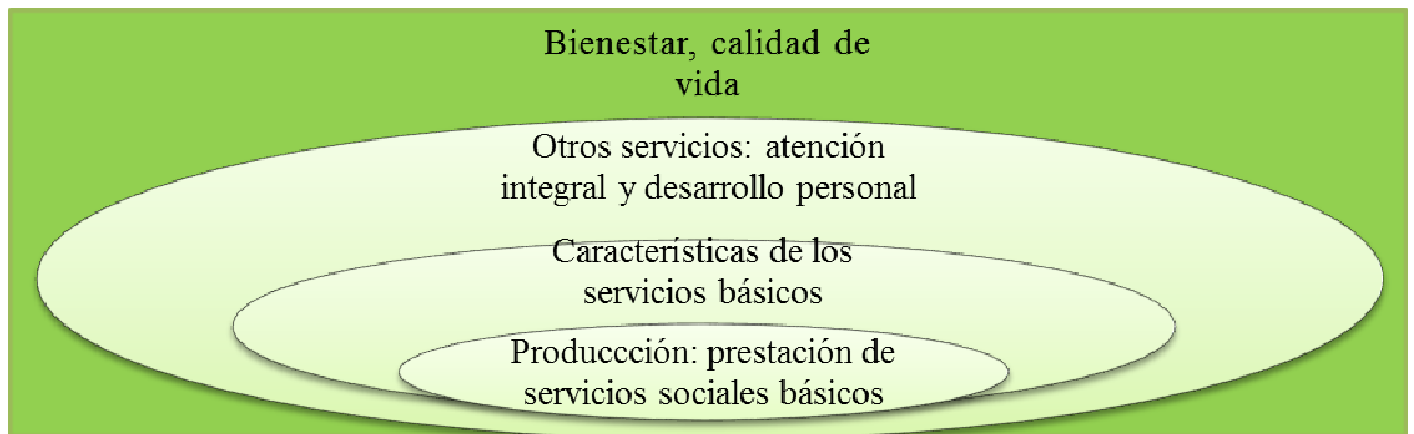
Gráfico 1. La residencia como organización

y la prestación de otros. En consecuencia, el proceso organizativo de las residencias que se ha establecido en este trabajo es el que aparece en el gráfico 1.