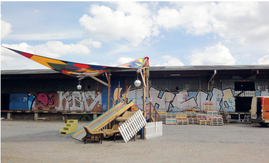
Abb. 3: Eindruck vom Hamburger Oberhafen (2017)