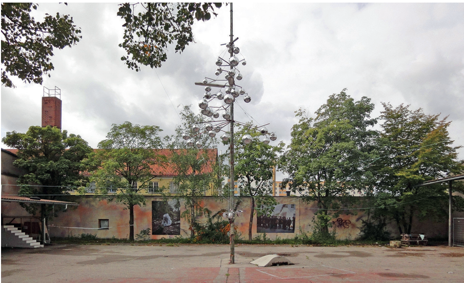
Abb. 1: Eindruck vom Münchner Labor (2017)

Nachdem 2007 die Realisierung des anspruchsvollen Entwurfs von Kazunari Sakamoto für die Neuplanung der Werkbundsiedlung abgelehnt wurde, sah die Stadt München 2011 die Chance, durch eine neue Wettbewerbsauslobung eine zusammenhängende Planung für das etwa 20 Hektar große Kreativquartier auszuschreiben. Denn das Besondere an diesem Areal war und ist die lebendige Kultur- und Kreativszene, die sich seit den 1990er Jahren im nordwestlichen Bereich niedergelassen hat. Ein Kreativquartier existierte also schon lange bevor der gleichnamige Wettbewerb ausgeschrieben wurde. Kreative Nutzungen sollten zwar erhalten, aber in den südlichen Teil umziehen, während im Großteil des Areals etwa 900 Wohnungen mit sozialer Infrastruktur, Büroflächen, Einzelhandel und Bildungseinrichtungen vorgesehen waren.