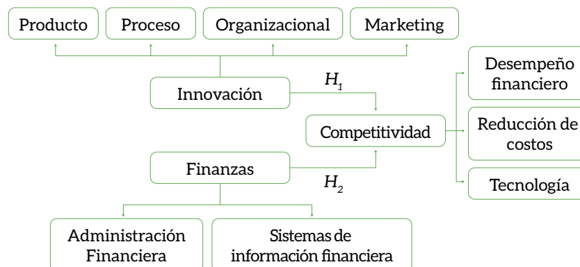
Gráfico 1. Modelo Teórico

En primera instancia se realizó el Análisis de Fiabilidad con la finalidad de evaluar la confiabilidad de las escalas de medida utilizadas. Los valores superiores a 0.70 en el resultado del coeficiente Alfa de Cronbach en cada una de las escalas que miden las diferentes variables, permiten interpretar que el estudio es suficientemente fiable. (Nunnally y Bernstein, 1994) La siguiente fase fue a través del análisis de validez de las escalas, el cual consistió en medir los supuestos del modelo teórico a través de las prue-