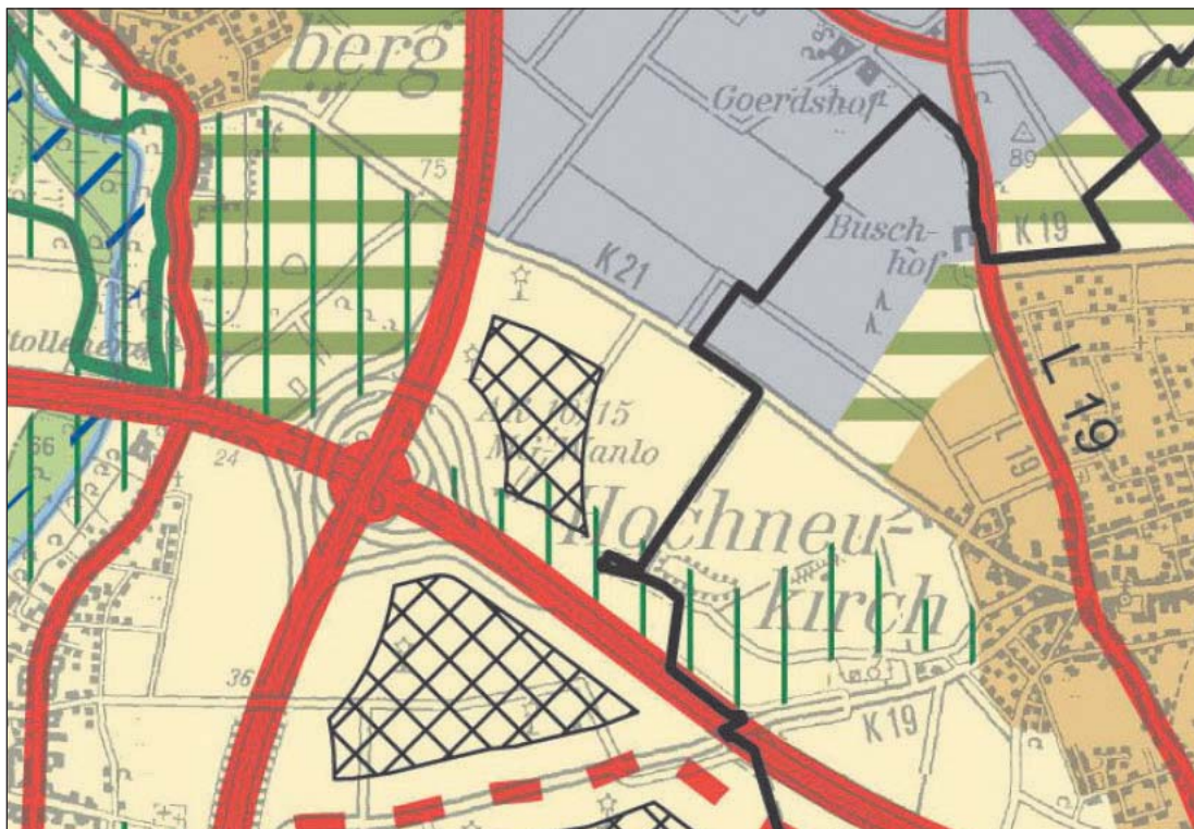
Abbildung 2: Beispiel für die Darstellung von Windenergiebereichen im Regionalplan gemäß § 2 ROG

Im Entwurf des Regionalplans Düsseldorf werden Vorranggebiete für Windenergieanlagen („Windenergiebereiche“, schwarze Schraffur) dargestellt.