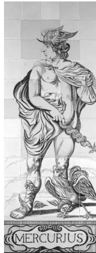
Niederländische Fliesenabbildung des Gottes Merkur aus dem 17. Jhd. im Schloss Oranienbaum bei Dessau (Weiss 2003)

Verwiesen wird mehrfach in der Studie auf die gesetzlichen Regelungen zu den Rechten und Pflichten des Auszubildenden und der Ausbilder sowie die eher spärlichen schriftlichen Aufzeichnungen über die Inhalte und Vermittlung beruflicher Kompetenzen. Neben der Ausbeutung von Auszubildenden und deren Züchtigung gab es auch zu Beginn des 20. Jahrhunderts eine Diskussion über die Berufsreife von Jugendlichen und deren Erfassung durch Tests. Eine weitere gesellschaftliche Diskussion in dieser Zeit war die Eingliederung der Auszubildenden nach der Ausbildung. Bezüglich der Literatur der Berufsausbildung in den Betrieben dominieren in der Zeitepoche bis in die 1920er-Jahre die Großbetriebe. Ein bildungspolitisches Thema, das sich wie ein roter Faden durch die deutsche Geschichte zieht, ist die Unübersichtlichkeit des Schulwesens. Bemerkenswert ist, dass der Staat erst ab den 1920er-Jahren, die Berufsbildung und Berufe stärker durch staatliche Vorgaben regelt. Die Betrachtung endet mit den Entwicklungen an den kaufmännischen Fortbildungsschulen und der Akademisierung der Fachinhalte.