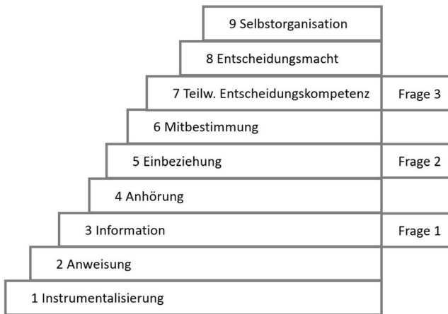
Abbildung 1 Verortung der Forschungsfragen anhand des Stufenmodells der Partizipation nach Wright/von Unger/Block (2010: 42)

odi, Albiez, Beecroft et al. (2016: 16) thematisieren, geht die dritte Forschungsfrage darüber hinaus, indem sie die Kerncharakteristika Transdisziplinarität und Transformativität genauer betrachtet. Dabei ist hervorzuheben, dass die Forschungsfragen insbesondere im Hinblick auf den für Reallabore relevanten Laborcharakter und Experimentierraum bedeutend sind, da eine Betrachtung aller ‚Bedingungen‘ für die Forschung im Reallabor erforderlich ist.