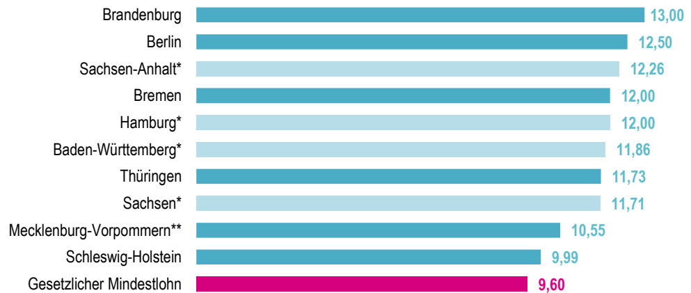
Abb. 2: Vergabespezifische Mindestlöhne in Deutschland in Euro, pro Stunde

* nach den aktuellen Koalitionsverträgen, noch nicht umgesetzt