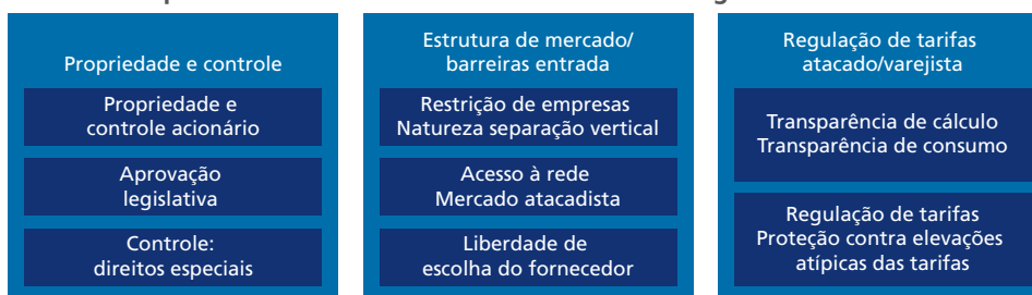
FIGURA 1 Fatores componentes dos indicadores de PMR: setor energia