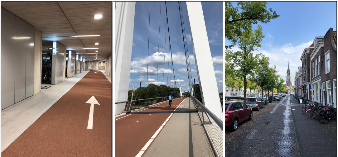
Radwege in Utrecht in Holland.

Kein Sektor ist so weit entfernt von dem Ziel, Treibhausgasemissionen zu senken wie der Verkehr. Seit nunmehr 25 Jahren sind diese Emissionen im Verkehr, die zu mehr als vier Fünftel dem Straßenverkehr geschuldet sind, mit leichten Schwankungen auf dem gleichen Niveau. In allen Sektoren gab es Fortschritte, sogar in der Landwirtschaft. Nur im Verkehr, prä-