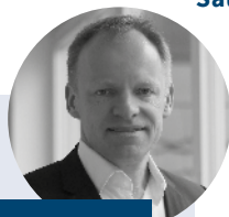
Prof. Dr. Dr. h. c. Clemens Fuest

ist Präsident des ifo Instituts und Professor für Volkswirtschaftslehre, Seminar für Nationalökonomie und Finanzwissenschaft, an der Ludwig-Maximilians-Universität München.