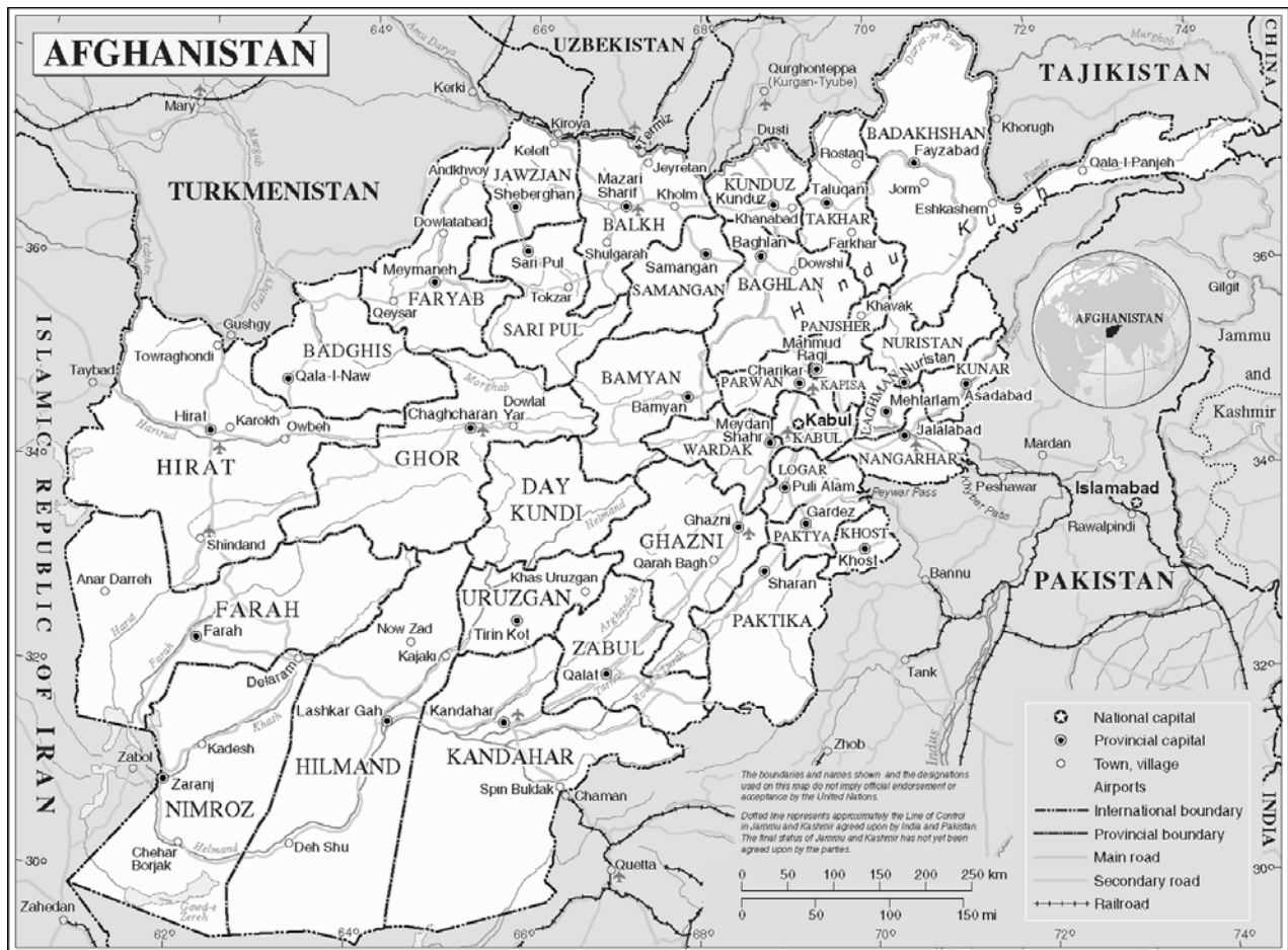
Afghanistan: Provinzen und regionales Umfeld