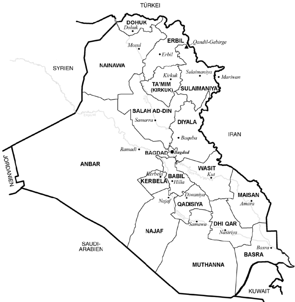
Irak: Provinzen und Provinzhauptstädte

vasion von 2003 bot, und trieben die Konsolidierung des politischen Systems in Irakisch-Kurdistan voran. Die irakisch-kurdische Politik wird bis heute von den beiden Einheitsparteien KDP und PUK dominiert. Sie räumten ihre Zwistigkeiten nach 1998 schrittweise aus und bilden heute ein faktisches Macht-Duopol. Die KDP wird dabei von dem Präsidenten der Kurdenregion, Masud Barzani, und seiner Familie angeführt, die PUK vom irakischen Präsidenten Jalal Talabani. Beide Parteien herrschen durchaus autoritär über die