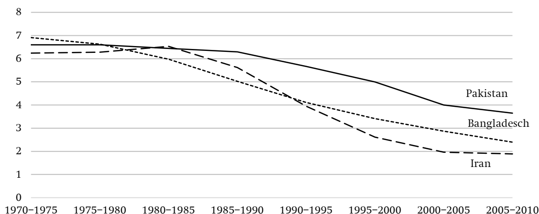
Abbildung Entwicklung der Geburtenrate (TFR) in Bangladesch, Iran und Pakistan