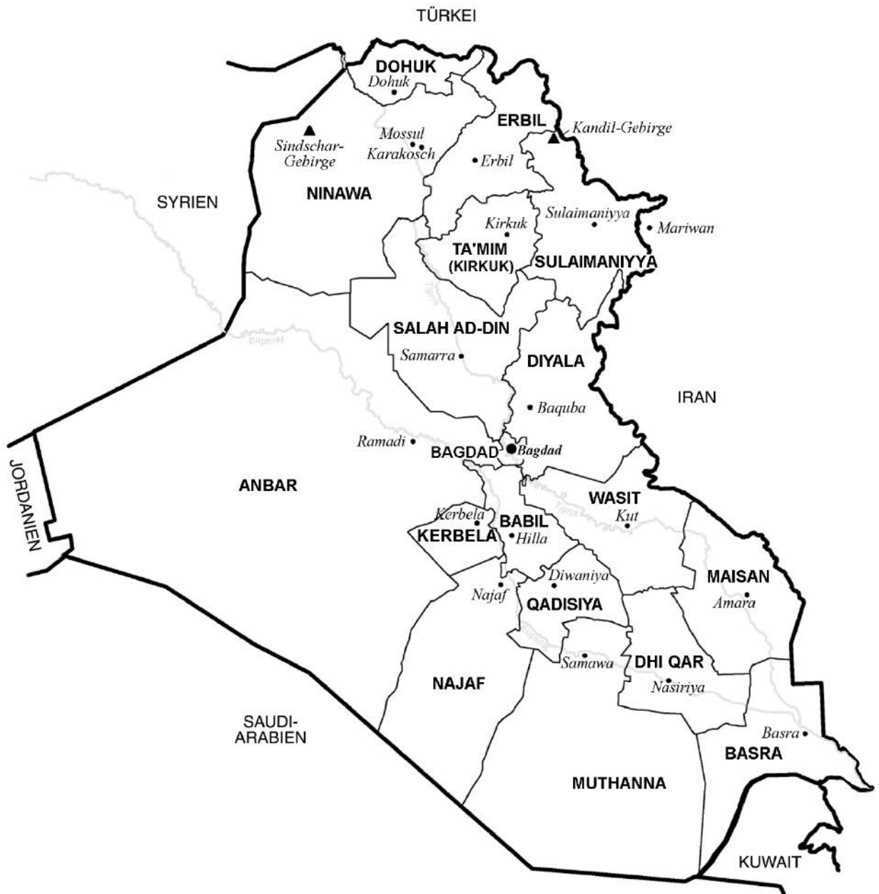
Irak: Provinzen und Provinzhauptstädte