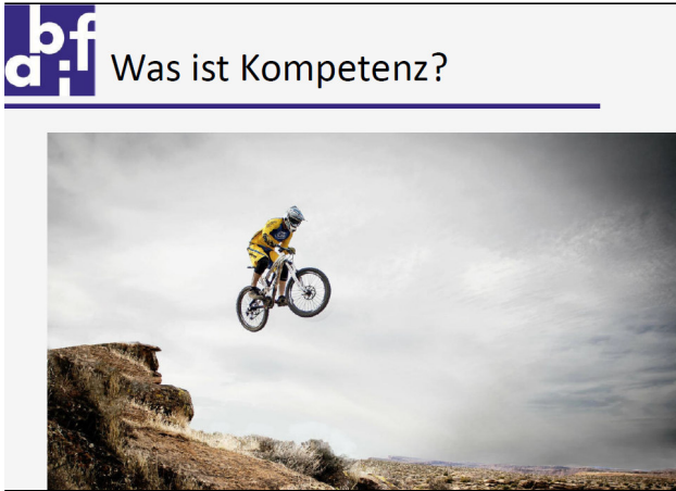
Was ist Kompetenz?