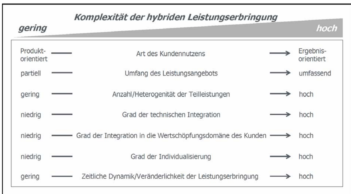
Abbildung 1: Merkmale der Komplexität hybrider Produkte

le Eigenschaft hybrider Produkte (S.8), so dass letztere in einem ersten Schritt als Leistungs-bündel definiert werden können, die eine kundenindividuelle Integration von Sach- und Dienstleistungsanteilen beinhalten (vgl. Burianek/Ihl/Bonnemeier/Reichwald 2007, Kersten et al. 2006). Gemäß einer solchen Definition wären jedoch die verschiedenartigsten Leistungs-bündel unter dem Begriff „hybrides Produkt“ zusammenzufassen. So wären beispielsweise sowohl eine Sachleistung mit ergänzenden produktbegleitenden Dienstleistungen (z.B. Sondermaschine mit vorherigen, kundenspezifischen Engineering-Leistungen oder Maschinen und Anlagen plus Installation, Wartung und Entsorgung) als auch Betreibermodelle als hybride Produkte zu bezeichnen. Aufgrund dieser Vielfältigkeit wurde in der Literatur ein erster Versuche unternommen, hybride Produkte zu typologisieren (Burianek et al. 2007). Da der Typologisierung ein Systemverständnis zugrunde liegt wird die Systemkomplexität als zentrales Unterscheidungskriterium herangezogen (vgl. zu dieser Vorgehensweise auch Benkenstein/Güthoff 1996). Demnach können die verschiedenen Erscheinungsformen hybrider Produkte auf einem Kontinuum von wenig bis sehr komplex eingeordnet werden. Zur Einordnung werden verschiedene Merkmale herangezogen, die Einfluss auf die Komplexität hybrider Produkte haben (vgl. Abb. 1).