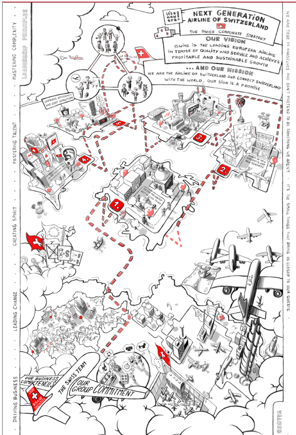
Abb. 1: Schlüsselvisualisierung der Strategie-Mobilisierung von Swiss Int. Air Lines.