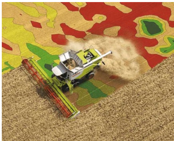
Abb. 1: Ertragskartierung

Digitale Features wie die Ertragskartierung gehören mittlerweile zur Standardausstattung moderner Erntemaschinen.