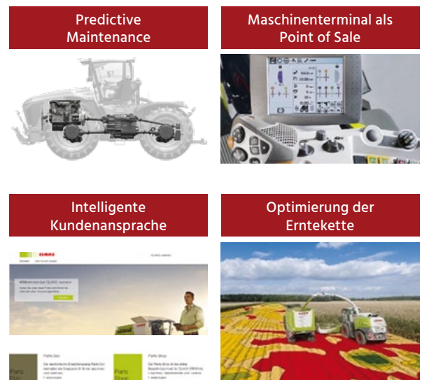
Abb. 2: Neue datenbasierte Use Cases