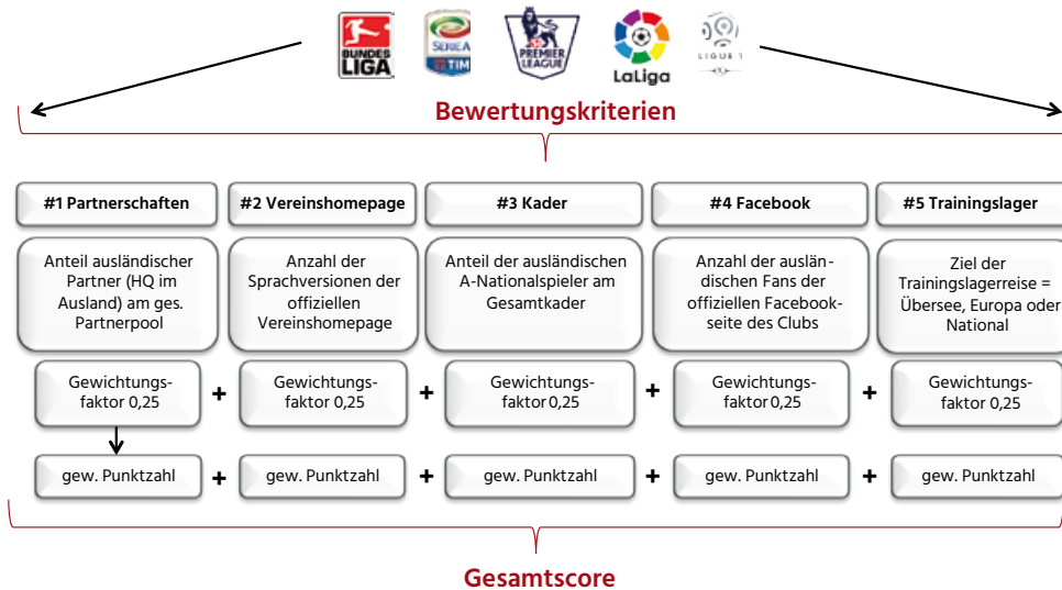
Abb. 1: Bewertungskriterien des Internationalisierungs-Rankings