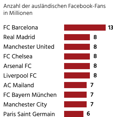
Abb. 2: Top 10 „ausländische Facebook-Fans“

Gewichtungsfaktor 0,2 Quelle: Fischer et al. 2015, S. 4.