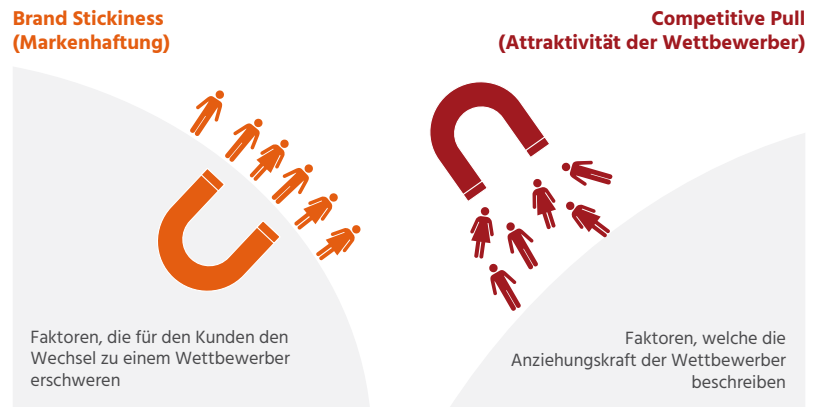
Abb. 2: Brand Stickiness vs. Competitive Pull

wahrgenommene Alternativlosigkeit eine Rolle. „Customer Harmonics“ berücksichtigt diese Wechselbeziehungen und misst zwei dynamische Größen, die einen direkten Einfluss auf