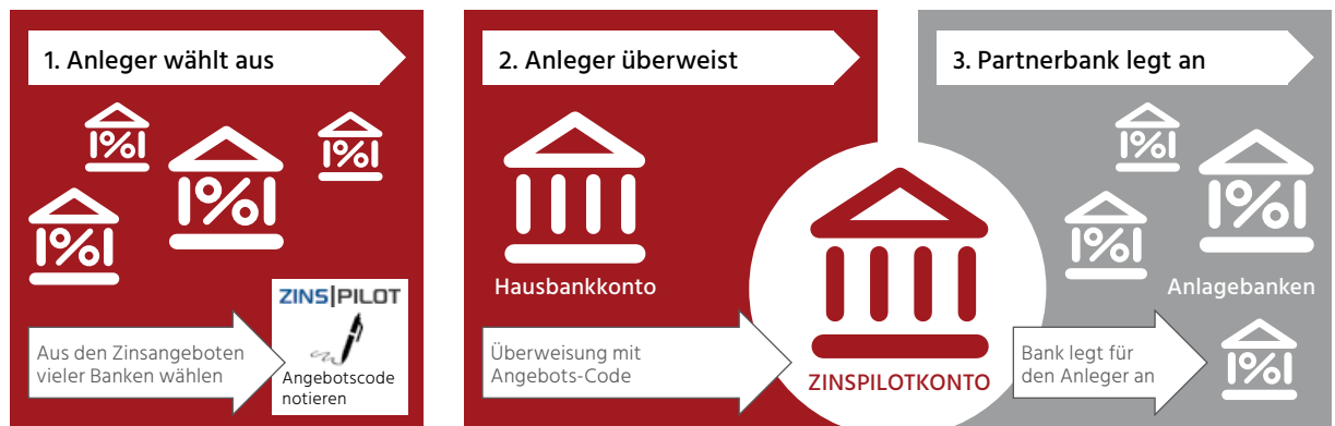
Abb. 2: Prozessübersicht Geldanlage bei ZINSPILOT