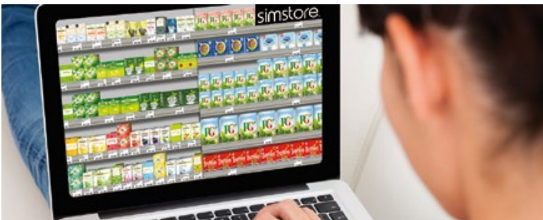
Virtuelle Regalansicht für Kaufsimulation mit Simstore®

Mit den virtuellen GfK-Simulationen haben Sie nun Ihr Pricing hinsichtlich der Normal-Preissetzung optimieren können. Doch wie sieht es aus mit der Aktionspreis-Gestaltung? Sollten Sie dies nicht ebenfalls testen und optimieren? Wir meinen: Ja. Und natürlich können Sie dies ebenfalls mit den