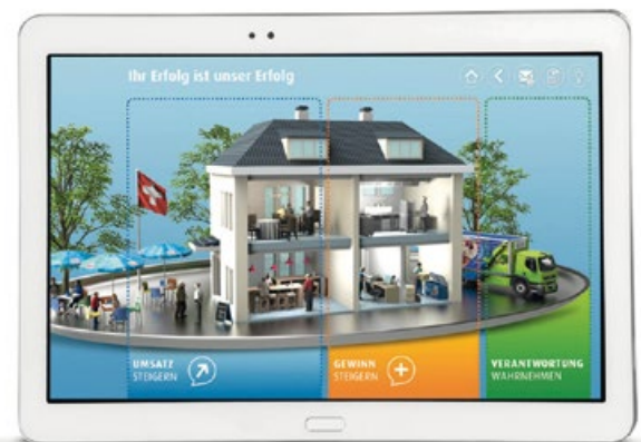
Abb. 2: Kundenzentrierter Canvas für verschiedene Gesprächseinstiege

Dabei helfen interaktive Tools in der Applikation wie der Margenkalkulator (vgl. Abbildung 3), Opportunitäten zu identifizieren und mit dem Kunden zu validieren. Beispielsweise gibt es das Konzept „Pasta-Herbstwoche“, welches aus saisonalen Rezeptideen, Menükarten und Verkaufsstellern besteht. Über die Inspiration „Wie wäre es, wenn Sie als Mittagsmenü eine ab-