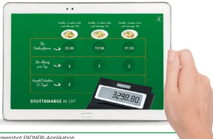
Abb. 3: Kalkulator zur Validierung von Konzeptideen