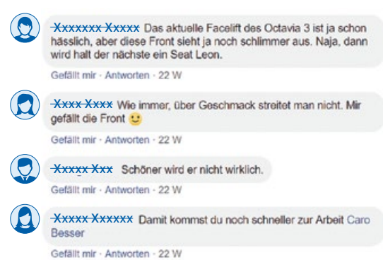
Abb. 1: Lästern über den neuen Skoda als ästhetischer Dialog