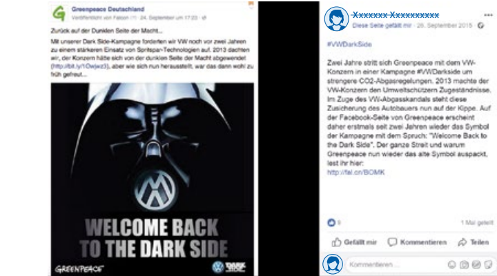
Abb. 1: Der Hashtag #vwdarkside greift das VW-Werbemotiv auf – ein Kritikdialog ethischer Verfehlungen

Pre-Tests, Autoshow oder Prototypen, aber auch die Beteiligung an Crowdsourcing-Aktionen lassen sich als solche Dialoge auffassen. Die Social Media stehen mit ihren Dialogen zwischen den Nutzern, aber auch im Dialog mit den Herstellern beispielhaft hierfür, die sich auf die Prozess- oder Ergebnisästhetik beziehen können. Das Stadtauto-Konzept des Fiat Mio deutet an, dass gesellschaftliche Ansprüche wie die Nachhaltigkeit des Individualverkehrs einen Aspekt der Ästhetik ausmacht (Pelzer/Wenzlaff/Eisfeld-Reschke 2012, S. 58). Die Skandale rund um Abgasttechnologien lassen sich als mangelnde (Marketing-)Management-