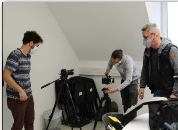
Abbildung 2: Dreharbeiten zu einem Video

Wird ein Video in einzelnen Punkten beanstandet, werden Änderungsvorschläge eingebracht und Korrekturen vorgenommen. Vertraglich vereinbart ist die Produktion von bis zu 14 Berufsinformationsfilmen jährlich mit einer Spieldauer von je maximal fünf und minimal 4,5 Minuten.