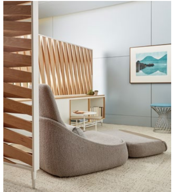
Steelcase Impressionen unterschiedlicher Coworking Spaces

Wir haben uns dazu verpflichtet, innovative Produkte mit möglichst geringen negativen Auswirkungen auf Mensch und Umwelt zu schaffen. Daher fertigen wir unsere Produkte möglichst ressourcen- und umweltschonend: durch Lebenszyklus-Analysen, entsprechende Zertifizierungen und durch Fertigung nach dem anspruchsvollen „Cradle-to-Cradle-Prinzip“.