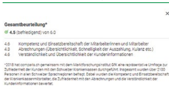
Abb. 1: Beispiel einer Comparis-Note für ein Krankenkassenangebot