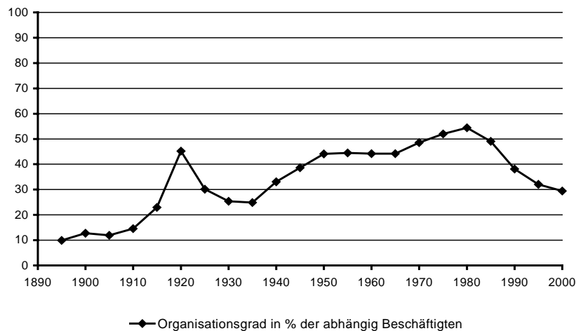
Abbildung 2. Gewerkschaftlicher Organisationsgrad 1895-2000 (in % aller abhängig beschäftigten Arbeitnehmer)