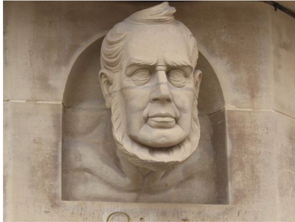
Abb. 4 List-Büste an einem Haus in der Friedrich-List-Straße in Stuttgart

auch von einem interessierten Publikum wirklich wahrgenommen wird. Friedrich Lists Werk ist nicht veraltet. Im Gegenteil! Die vorliegende Monographie erhellt diesen Sachverhalt auf eindrucksvolle Weise.“