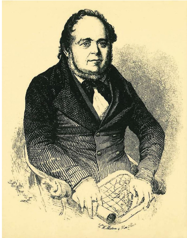
Abb. 2 Friedrich List in mittleren Jahren als Verkehrswirtschaftler

nahezu vergessene ans Licht und bringt vor allem aus vom Verfasser gesammelten Quellen manches Unbekannte. Doch auch Bekanntes gewinnt in der originellen Zusammenstellung des Werkes ein neues Gesicht und Gewicht. Der über rund ein- einhalb Jahrhundert reichende, weltumspannende Einfluss List'scher Ideen (freilich auch ihrer nicht seltenen Missverständnisse) wird eindrucksvoll deutlich.“