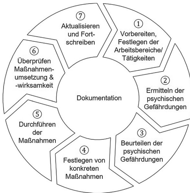
Abb. 2 Prozess der Gefährdungsbeurteilung psychischer Belastung. (In Anlehnung an BAuA 2020)

ratorinnen und Moderatoren besser in der Lage sind, mit Beschäftigten in Workshops realistische Lösungsvorschläge zu erarbeiten.