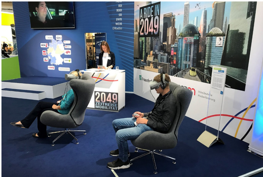
Abb. 1 Standaufbau der VR-Befragung auf der Internationalen Automobil-Ausstellung (IAA) 2019