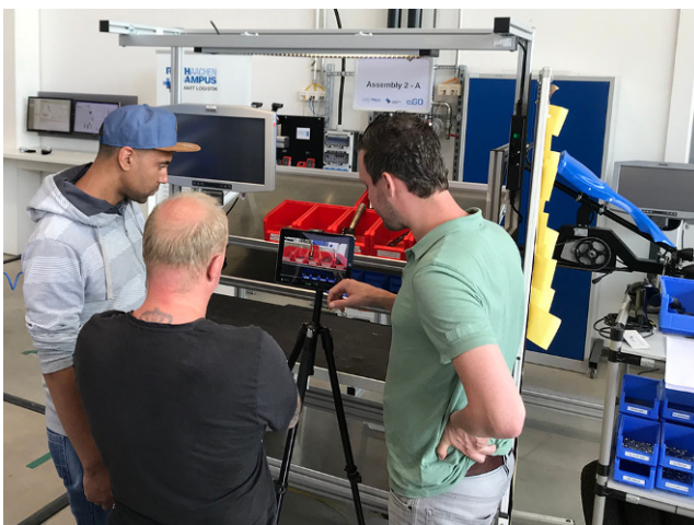
Abb. 3 Lernbegleiter diskutiert Optimierungsziel beim Rüstprozess anhand einer Tutorialszene

Dies ermöglicht es, die selbst aufgeworfenen Fragestellungen beim Tutorialdrehen zu strukturieren und verschiedenen Sichtweisen zuzuordnen. So werden beispielsweise im Rüst- und Montageprozess typische Fragen der Humanisierung und Rationalisierung eingebracht. Insbesondere die Verknüpfung von vor- und nachgelagerten Teilprozessen mit dem im Tutorial abgebildeten Teilprozess wird durch die kontinuierliche Optimierung aufgrund der Reflexionen vergegenwärtigt. Teilnehmende, die den wertschöpfenden manuellen Montageprozess für das Tutorial auswählen, werden dabei häufig auch mit Fragestellungen der Materialbereitstellung konfrontiert, z. B. wenn die Montagetätigkeit im Tutorial durch viele Kameraeinstellungen abgebildet werden muss, weil im Rüstprozess keine Anordnungsregeln oder Heuristiken mit fragwürdigen Zielstellungen genutzt worden sind.