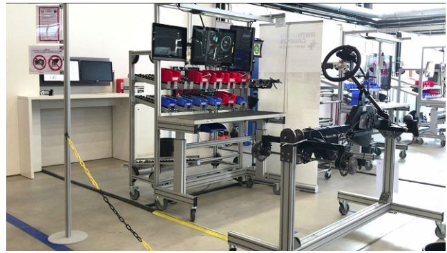
Abb. 1 Lernort Kartmontage in der Demonstrationsfabrik Aachen Fig. 1 Learning place cart assembly in the demonstration plant Aachen

Durch das modulare Fertigungslayout ist es möglich, einen parallelen Arbeitsplatz zur Montage der Kartvorderachse einzurichten. Das bedeutet, dass die reguläre Fertigung direkt neben den Lernplätzen stattfindet. Zur Schulung ist ein älterer Prototyp des e.go Karts eingesetzt worden, der didaktisch präpariert worden ist. So ist eine verschleiß-