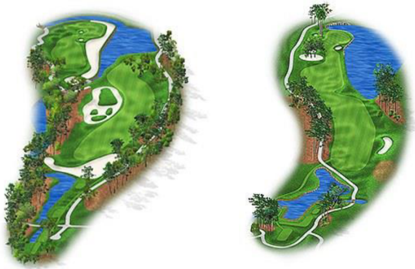
Abbildung 2: Going-for-it-Löcher