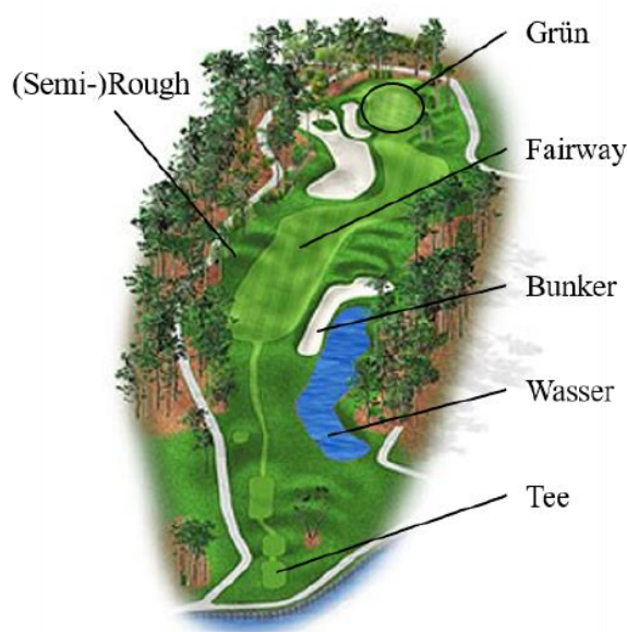
Abbildung 1: Bereiche einer Spielbahn

doch bei einem nicht perfekt ausgeführten Schlag auch die erhöhte Gefahr, dass der Golfball in einem Wasserhindernis, Bunker oder einer anderweitig schwierigen Lage landet, was möglicherweise zu einer höheren Anzahl an benötigten Schlägen, auch Score genannt, führt, als wenn der Golfer sich nicht dazu entschieden hätte, das Grün anzugreifen. Aufgrund der nicht-linearen Verteilung der Preisgelder bei PGA TOUR-Turnieren kann jeder zusätzliche Schlag bzw. jeder Schlag weniger, den ein Spieler im Vergleich zu den anderen Teilnehmern benötigt, zu großen Unterschieden beim verdienten Preisgeld führen. Deshalb gilt es bei der Entscheidung, das Grün anzugreifen, die Chancen und Risiken sehr gut abzuwägen.