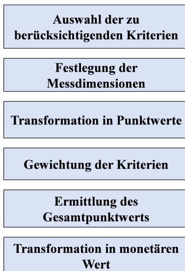
Abbildung 2: Die sechs Schritte des Scoring-Modells nach Baetge et al. (2013), in Anlehnung an Baetge et al., 2013, S. 314.

auf Prozentpunkte zwischen 0% und 100% normiert. Für Spieler der Ligen, die nicht durch Opta erfasst werden, ist die Spielstärke anhand eines weiteren Scoring-Modells wie beschrieben zu ermitteln. Hierbei gilt zu beachten, dass die Gewichtung der Eigenschaften in Abhängigkeit der Spielerposition erfolgen soll (vgl. ebd., S. 316 f.). So ist z.B. die Zweikampfquote wichtiger für einen Abwehrspieler, während die Toranzahl zentraler für einen Stürmer ist (vgl. Fischer et al., 2006, S. 315).