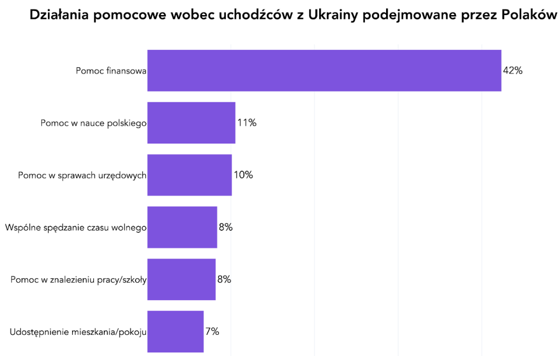
Wykres 1. Działania pomocowe wobec uchodźców z Ukrainy podejmowane przez Polaków