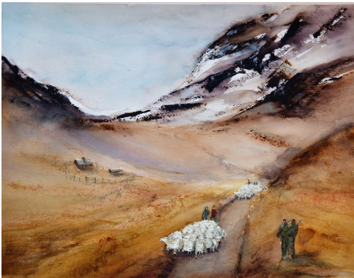
Figur 1: Sauesankere på veg ned fra fjellet og småviltjegere på veg opp. Illustrasjon: Inger Kristin Gorseth.